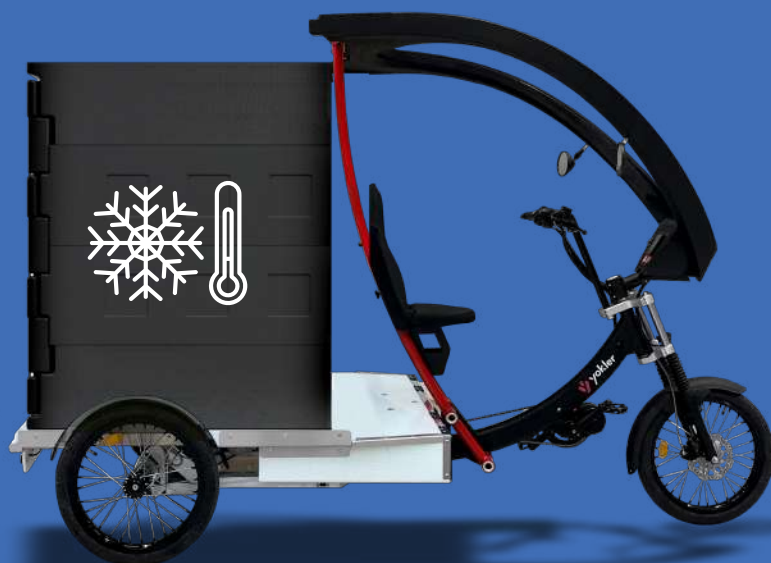
MODELE YOKLER COLD